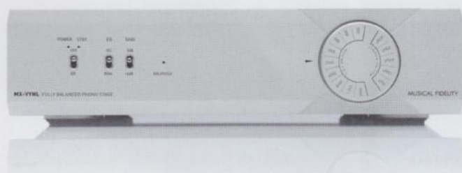
Beeindruckende Mischung aus Auflösung und Natürlichkeit: MX-Vynl