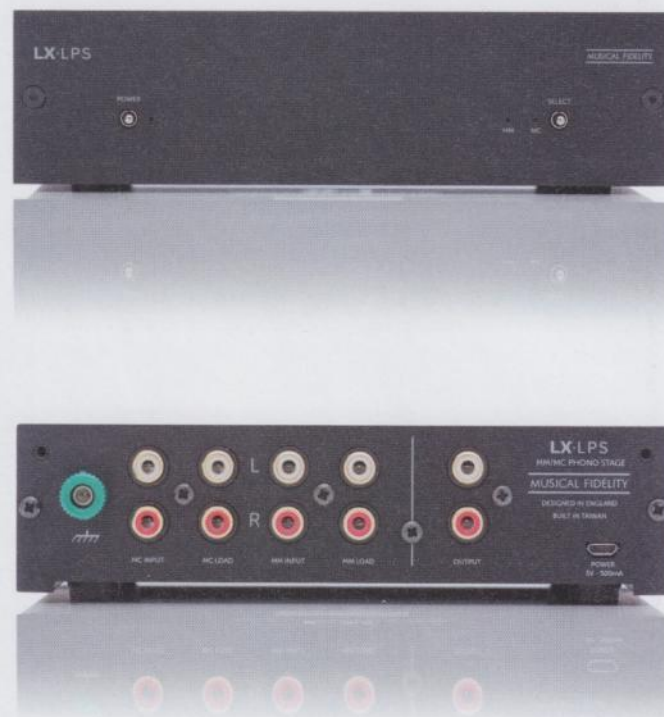
Kaum noch zu verbessern: Music Fidelitys LX-LPS

Die Zunahme an Natürlichkeit und Luftigkeit, die der optimale Abschluss eines MC-Systems ermöglicht, ist nicht zu überhören. Aber selbst wenn man zu Vergleichszwecken bei den Standardwerten bleibt, distanziert der LX-LPS den V90 LPS im Hörtest überraschend deutlich: Das Klangbild wirkt weicher, feinkörniger