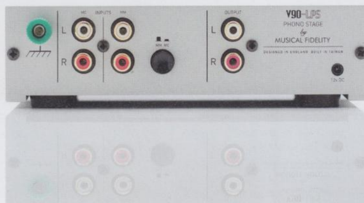
Dynamik trifft auf Weite: V90 LPS