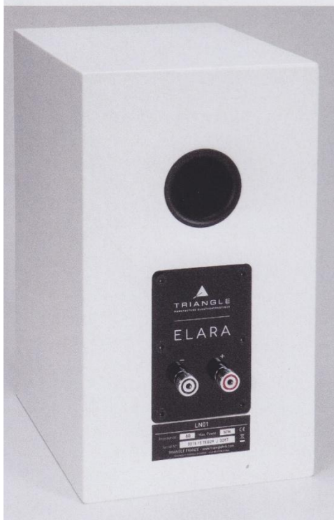
Triangle setzt bei der kompakten Elara auf ein hochwertiges Single-Wiring-Terminal.

Der französische Lautsprecher-spezialist Triangle ist bekannt für anspringend lebendige, wirkungsgradstarke Lautsprecher mit Hochtöner. Für angepeilte 500 Euro Paarpreis ist der Einsatz dieser legendären Hochtöner freilich nicht möglich, sodass Triangle für seinen günstigsten Kompaktlautsprecher Elara LN01 nach etlichen Hörversuchen auf eine gänzlich anders klingende 25-mm-Seidenkalotte zurückgriff. Man paarte diesen ausgesuchten Treiber mit einem beschichteten 135er-Papier-Konustreiber, beide übrigens mit sehr starkem Antrieb und arbeitsteilig über eine unkomplizierte Weiche verbündet.