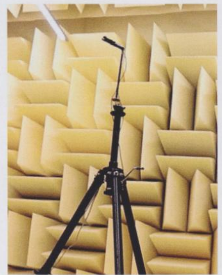
▲ Triangle verfügt zur Entwicklung über einen (nahezu) „schalltoten“ Raum.

Natürlich erreicht sie in Sachen Plastizität nicht High End, das zu verlangen wäre irre und unfair. Der Bass ist angenehm rund sowie leicht warm, und sie ist sie auch nicht völlig frei von Verfärbungen, aber die Triangle macht großen Spaß und bietet fürs Geld wohl ein Optimum an Klang und Gegenwert. Ihr Bass ist bei der „Blues Company“ physisch spürbar und kraftvoll, sie braucht tatsächlich etwas Auslauf, um sich zu entfalten. Die LN07 gibt es ausschließlich in Piano-Hochglanzschwarz oder Hochglanzweiß. Ein veritabler Preistipp!