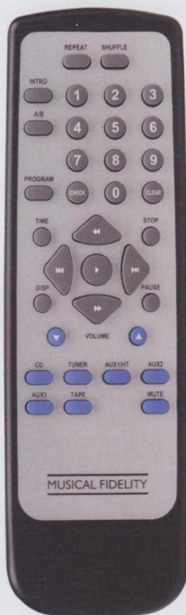
Dank des motorisierten Volumenpotis macht es ungewohnt viel Spaß mittels der mitgelieferten Fernbedienung den Pegel zu regeln

Auch wenn mittlerweile der Schriftzug „An Austrian Company“ auf der Verpackung prangen mag, so bleibt der Sound der Fir-