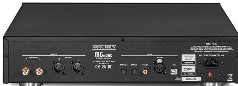
Die Rückseite des M6x DAC von Musical Fidelity: Fünf Eingänge treffen auf zwei Ausgangspaare (RCA/XLR).

Wie alle M6er ist dieser jüngste Vertreter im typischen 44er-Gehäuse der Serie aufgebaut. Es strahlt mit seiner zehn Millimeter dicken, oben wie unten leicht angeschrägten Aluminium-Front und der stattlichen Tiefe von 39 Zentimetern (inklusive Buchsen) eine sachliche Präsenz und gediegene Wertigkeit aus. Betrachtet man bei gelüftetem Deckel die »Innereien«, scheint das Gehäuse eine Nummer zu groß geraten, die Platinen hätten auch weniger Platz beanspruchen können. Doch erhöhter Abstand der separierten Arbeitsbereiche untereinander zahlt auf das Konto der Störfestigkeit ein, und somit wird das raumgreifende Format gerne akzeptiert. Zumal es harmonisch zu allen anderen Musical-Fidelity-Geräten der Produktlinien M2, M3, M5, M6 und M8 passt. Diese positive Zeitlosigkeit einer klassischen Anmutung kann ich der mitgelieferten Fernbedienung leider nicht zusprechen: Sie wirkt in Form und Farbgestaltung gelinde gesagt gestrig. Funktional gibt es aber nichts an dem praktischen Befehlsgeber auszusetzen.