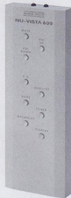
▲ Übersichtliche und wertige Metallfernbedienung

Ein geradezu atmender Bassbereich, als wir uns die Lumineers mit ihrem Album „Cleopatra“ zur Gänze genehmigten. Die Zeit vergessen, weil die Musik den Zuhörer gewaltlos gefangen nimmt, es kein Entkommen gibt. Dass der 600er ein Eckchen weniger Leistung als sein großer Bruder zur Verfügung stellt und im Bass etwas mehr das „Laisser faire“ zur Philosophie macht – wen kümmert's? Michael Lang