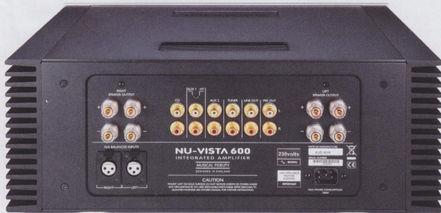
▲ Hochwertiges Anschlussfeld inklusive XLR-Eingang und Bi-Wiring-LS-Anschlüsse