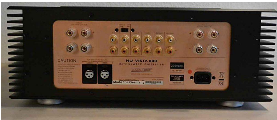
Vollverstärker Musical Fidelity Nu-Vista 800.