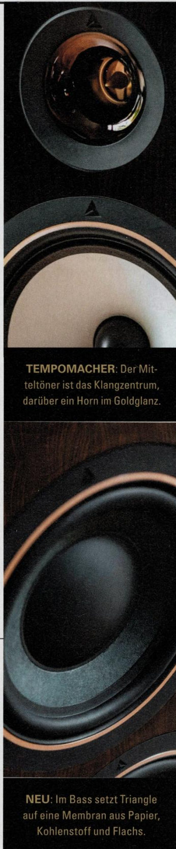
TEMPOMACHER: Der Mitteltöner ist das Klangzentrum, darüber ein Horn im Goldglanz.

Schauen wir in die Höhe: Hier haben wir ein Hochtornhorn. Sieht klein aus, kann aber ungemein viel. Vor allem hält es im Timing den Vorgaben des Mitteltöners stand. Das ist ein Magnesium-Verbund, was ein kritisches Material sein kann. Triangle veredelt es mit ano-